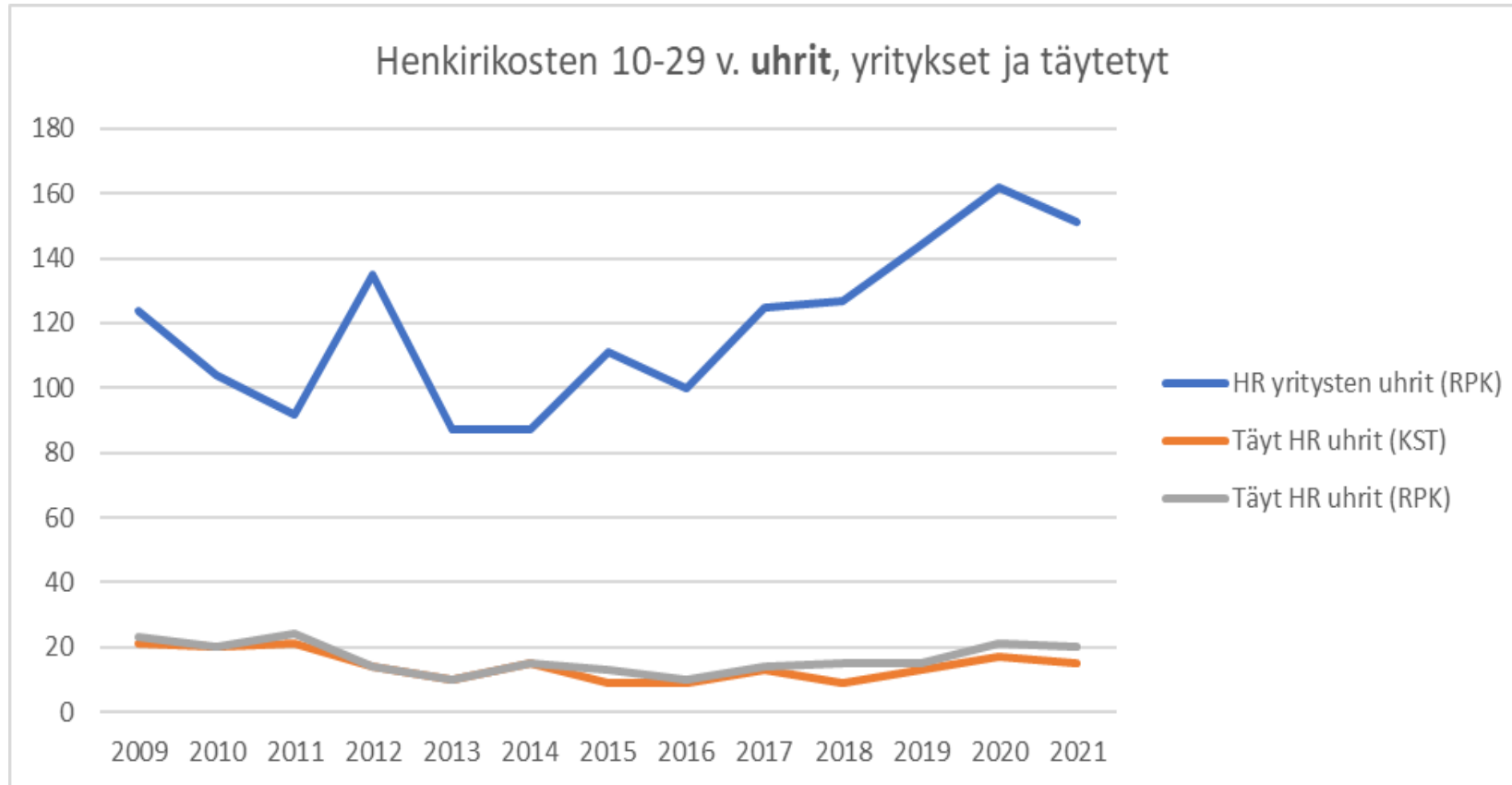
Kuvio 3 Henkirikosten yritysten 10-29 vuotiaat uhrin 2009-2021. Rikos- ja pakkokeinotilasto, Tilastokeskus. (Vertailu täytettyihin henkirikoksiin)